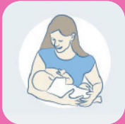
la Madone inversée