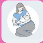
la Madone allongée