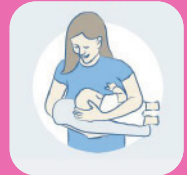
le ballon de Rugby